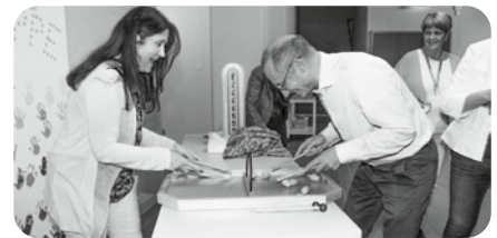
Spielfreude am Behörden-Anlass - Stadtpräsident und Stadträtin im Barik-Wettkampf