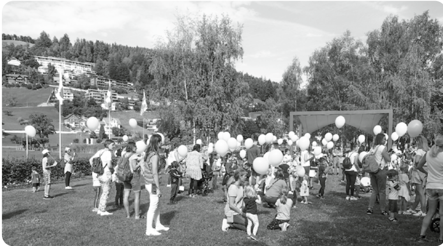
Ballonwettbewerb am Jubiläumsfest