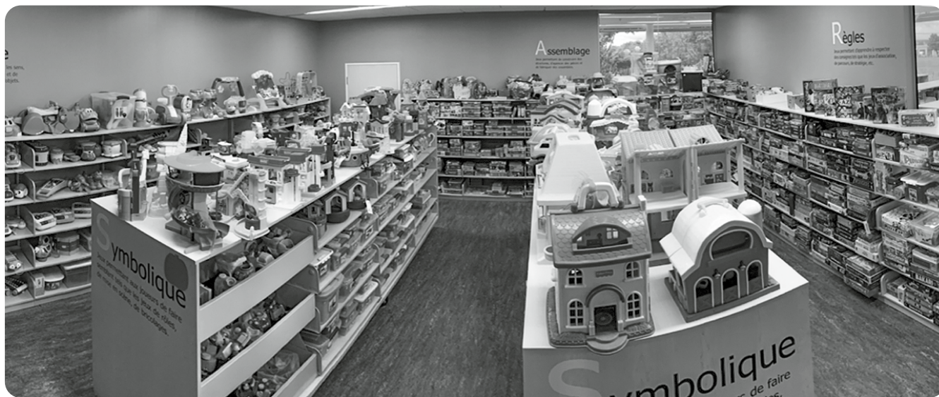
Espace réservé au prêt et le public y a accès / Dieser Raum ist für die Ausleihe reserviert und für die Öffentlichkeit zugänglich