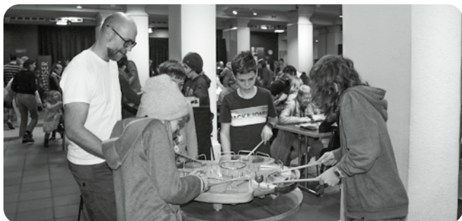
Der «Chüngel» begeistert immer wieder