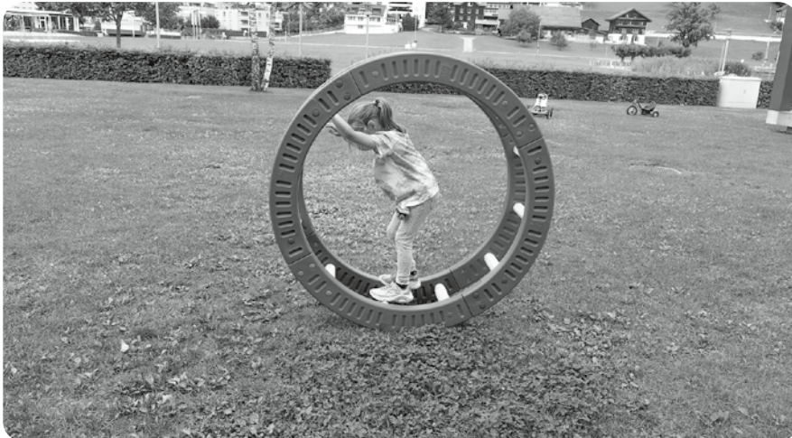
Im Hamsterrad vorwärtskommen