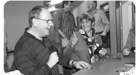
Am Spielabend – Pass uf, was machsch!