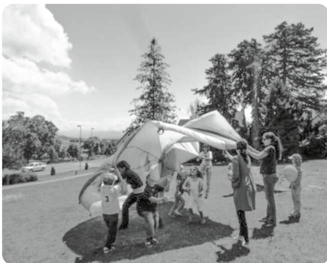
Nationaler Spieltag 2011 in Rüschiikon / Journée du Jeu 2011 à Rüschiikon