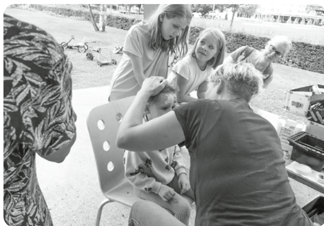
Kinderschminken, der Hit, auch zum Zuschauert