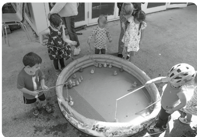
Fischen braucht Geduld und Hingabet