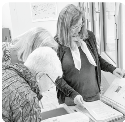
Schwelgen in Erinnerungen - Ehemalige Ludothekarinnen blättern in der Chronik