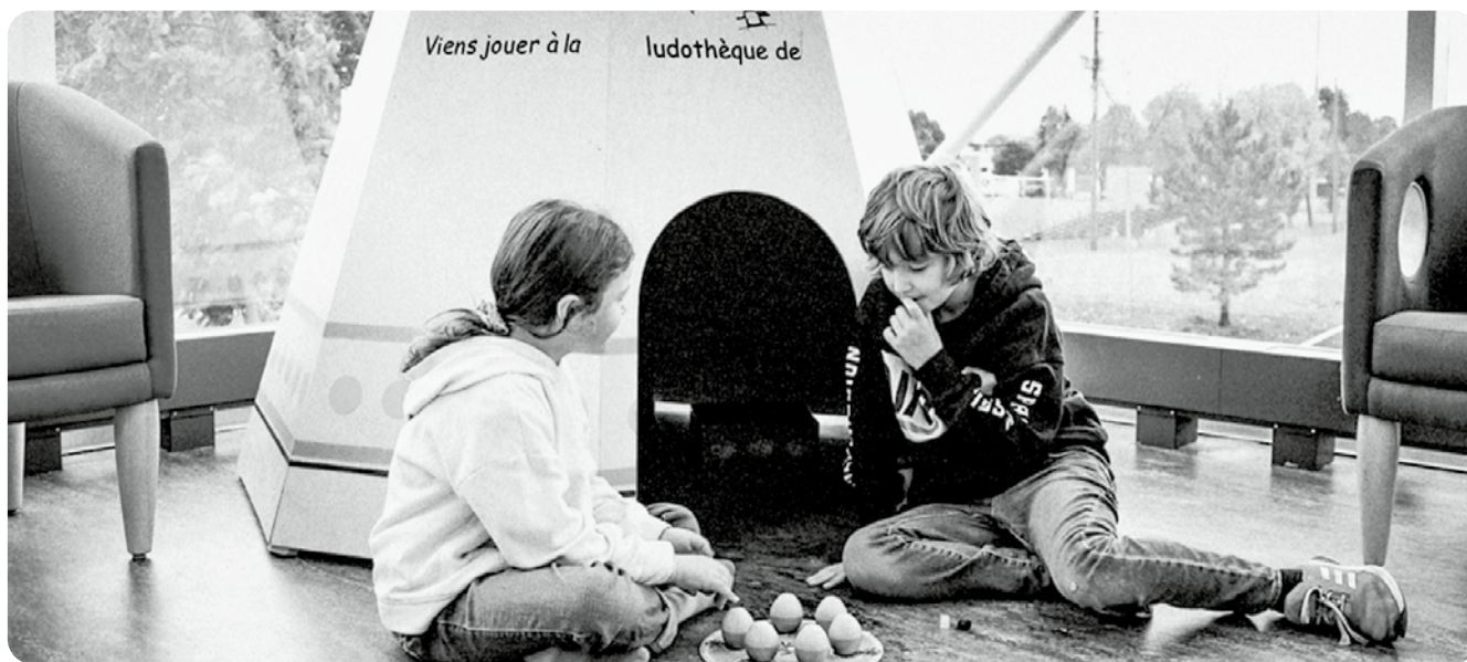
Jouer sur place en profitant de la vue/Spielen vor Ort mit Aussicht