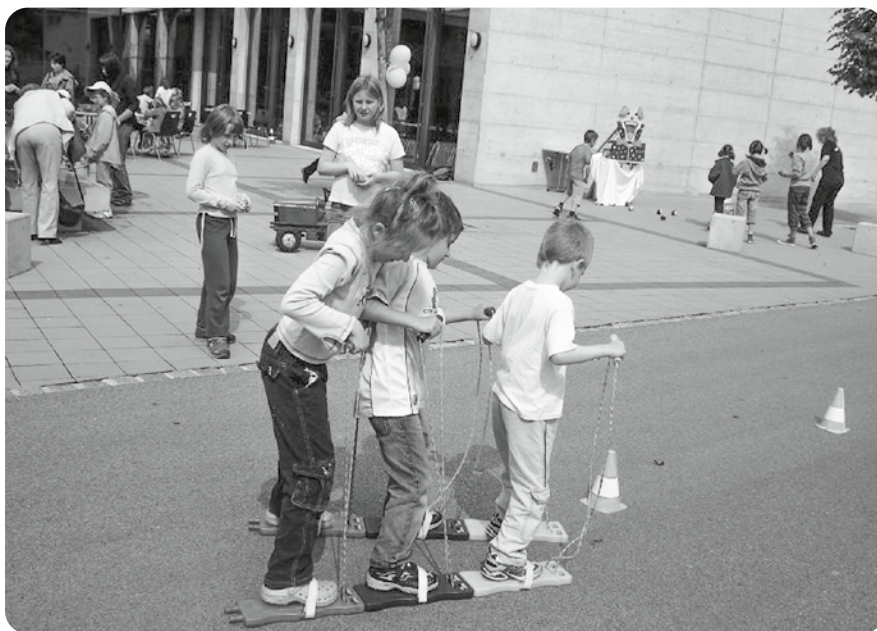
Journée du Jeu 2008 à Vicques / Nationaler Spieltag 2008 in Vicques