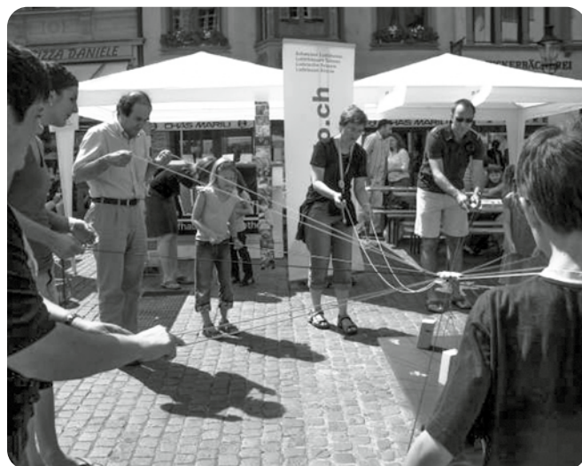
Nationaler Spieltag 2008 in Schaffhausen / Journée du Jeu 2008 à Schaffhouse