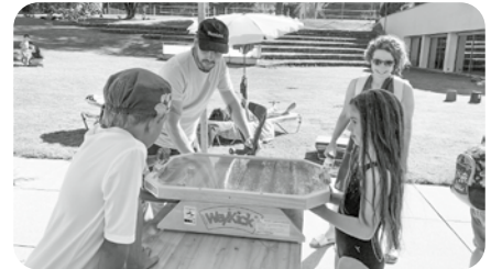
Spielplausch in der Badi