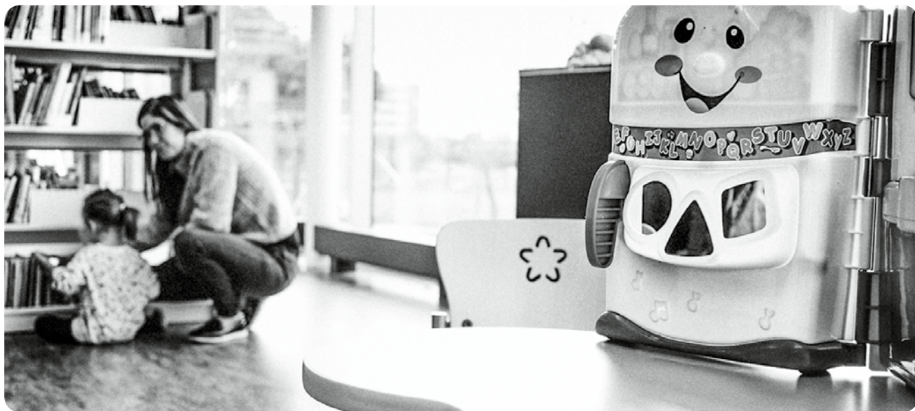
La ludothèque est désormais installée dans la bibliothèque / Die Ludothek ist neu in der Bibliothek beheimatet