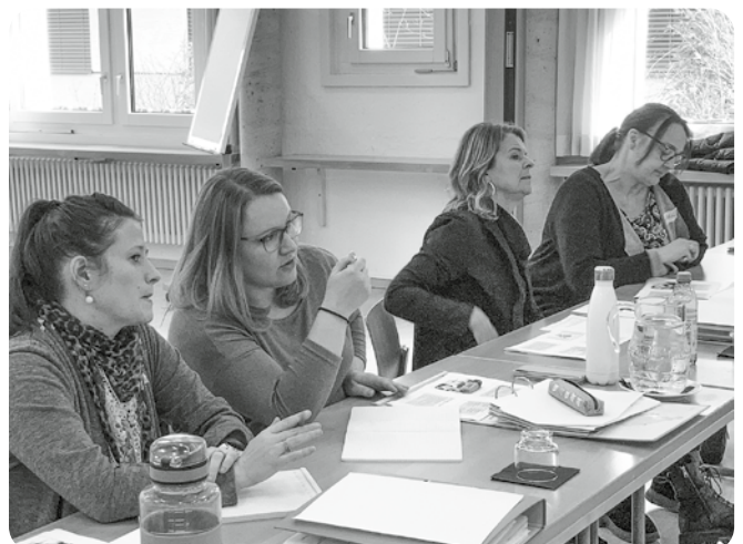
Volle Aufmerksamkeit – alles will mitbekommen werden