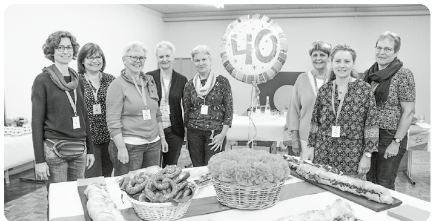
Ludo-Team Kloten - nicht ganz vollständig