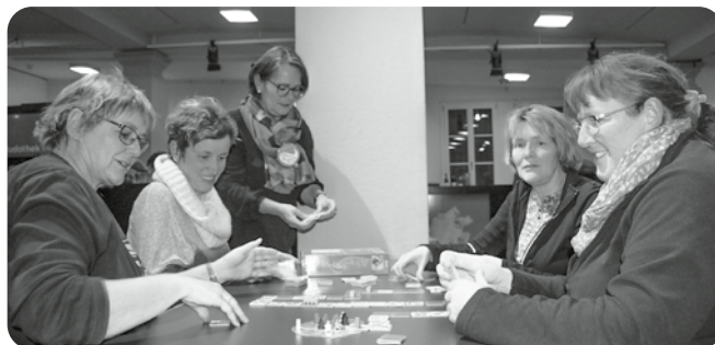
Atlantis spielen fordert die Aufmerksamkeit und macht offensichtlich auch Spass